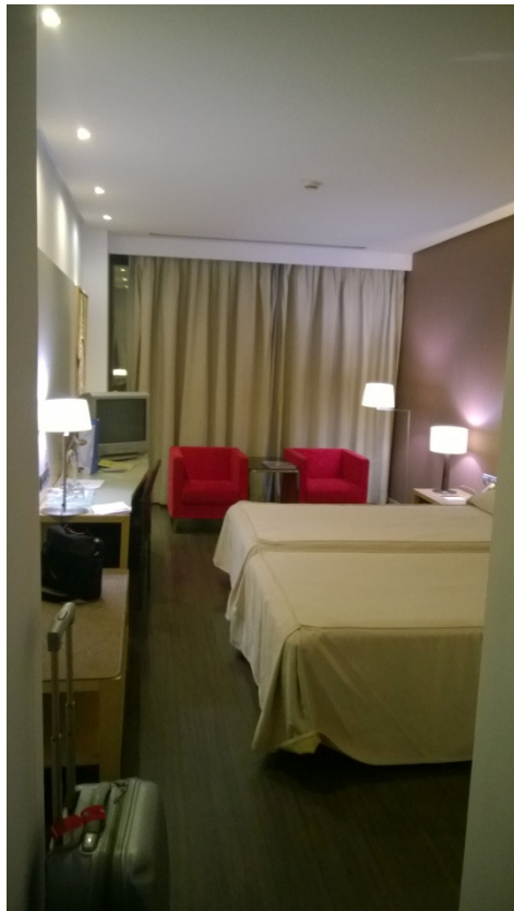
kuva huoneestani Silken Puerta hotellista, ihan mukavasti tilaa yhdelle. Hintakaan ei päättä huimannut 58 € yö.